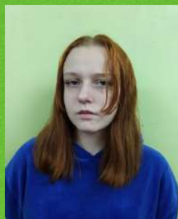
Заместитель командира отряда